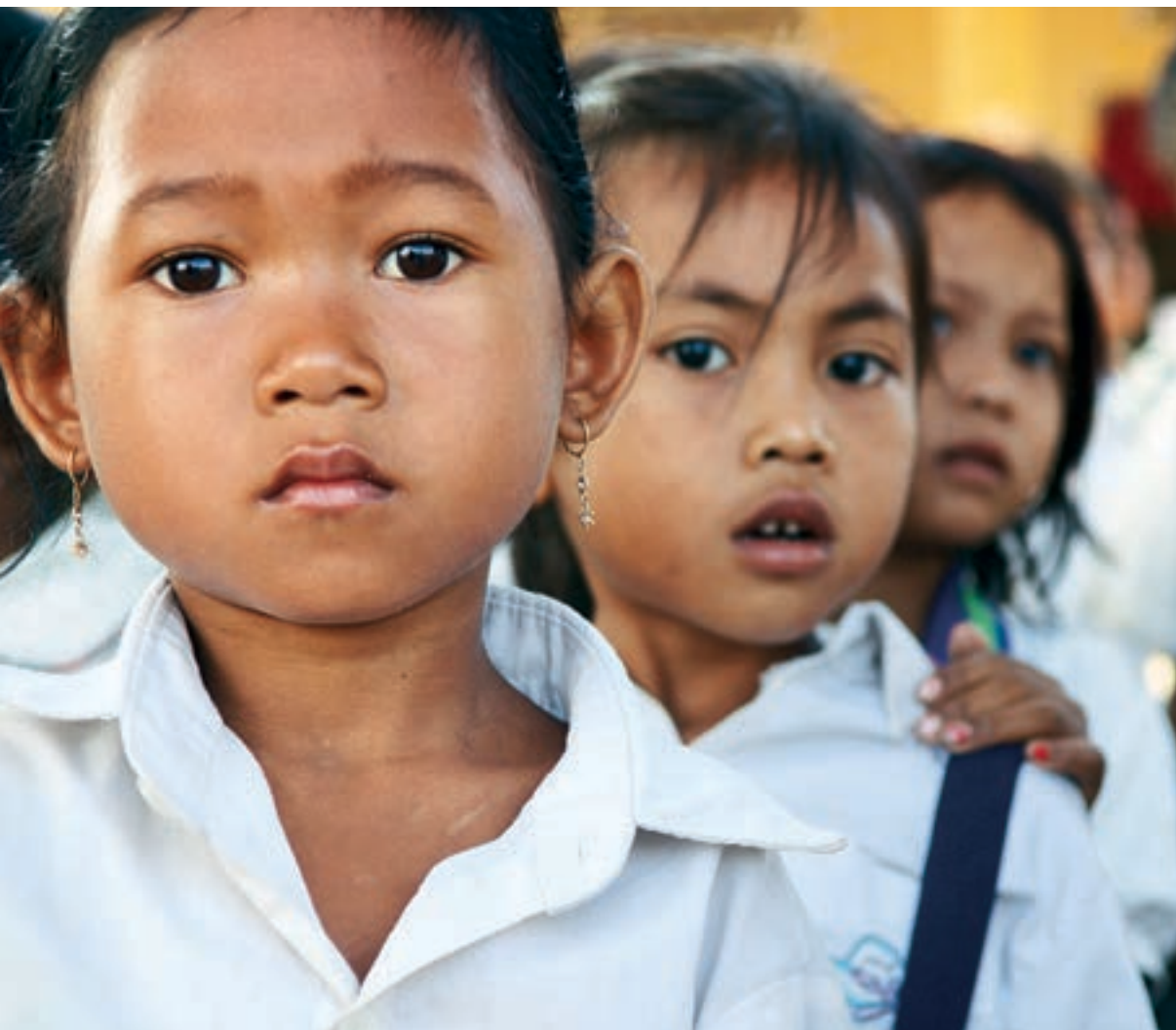
▲ Des filles font la queue dans une école du Cambodge.