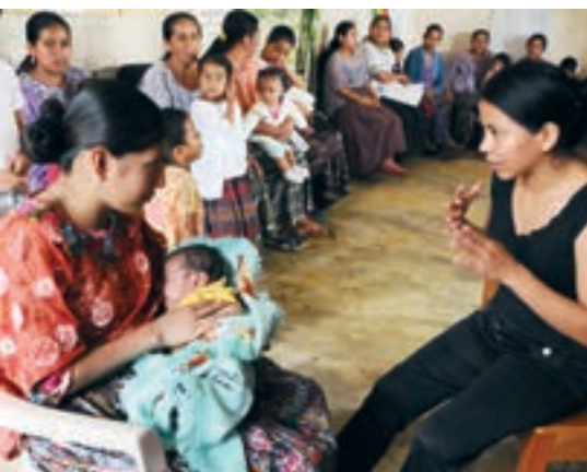
▲ Une professionnelle de la santé s'entretient avec une femme qui allaite sa fille dans un dispensaire de la ville de Cobán, au Guatemala.

Heureusement pour les décideurs, les données factuelles essentielles sont fournies par les enquêtes auprès des ménages, qui couvrent un grand nombre de personnes et emploient des méthodes capables de générer des données fiables, normalisées et comparables, s'appuyant sur des expériences réelles. De plus en plus, les enfants et les jeunes participent à ces études et aux activités de plaidoyer qu'elles permettent de mener.